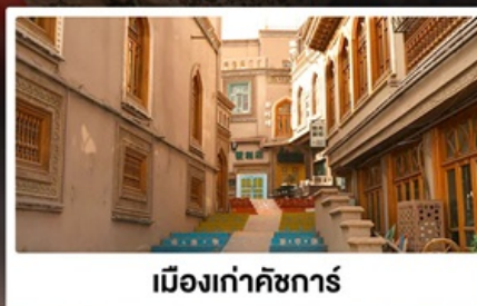
เมืองเก่าคัชการ