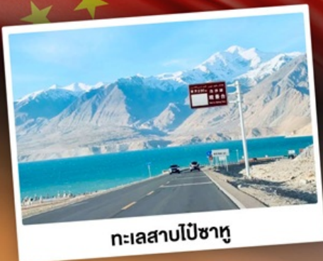
ทะเลสาบไปซาทุ

“ซินเจียงใต้” ดินแดนแห่งทะเลทราย สัมผัสวัฒนธรรมของชาวซินเจียงอุยกูร์