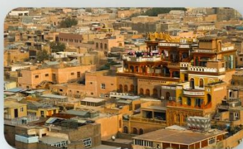
เมืองเก่าคีซการ