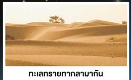
ทะเลทรายทากลามากัน