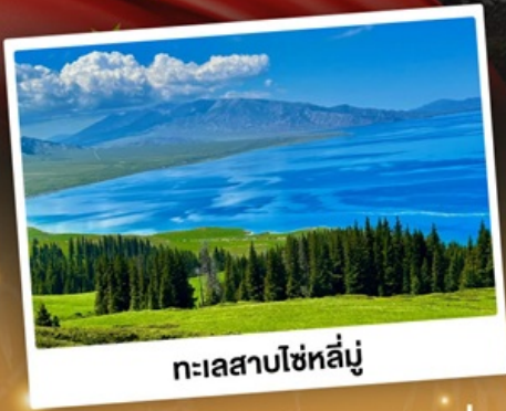
ทะเลสาบโซห์ลัมู่

ชมวิวดอกคังการแบบยุโรปผสมเอเชีย ทุ่งหญ้าเขียวฉ่ำ ทะเลสาบสีเทอร์ควอยซ์