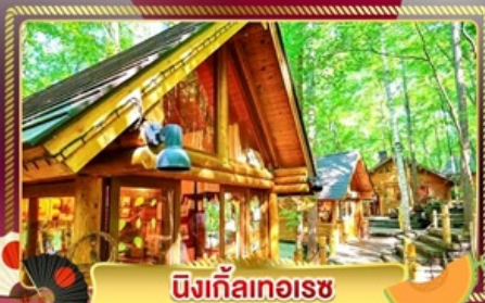
นิงเกิ้ลทอเรซ