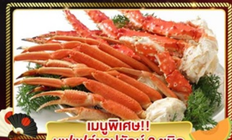
เมนูพิเศษ!! บุฟเฟ่ต์ขาปูยักษ์ 3 ชนิด