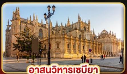
อาสนวิหารเซบิยา