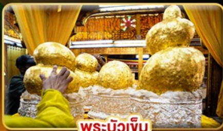
พระบิวเข้ม