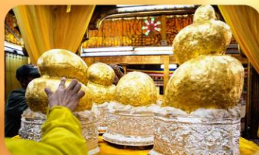
พระบิวเข้ม