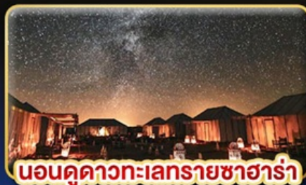
นอนดูดาวทะเลทรายซาฮารา