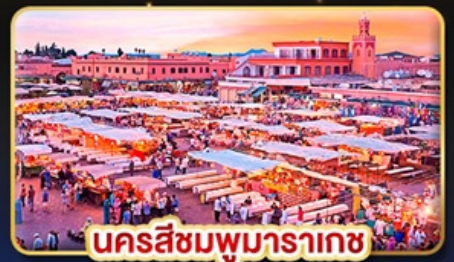
นครสีชมพูมารากะช