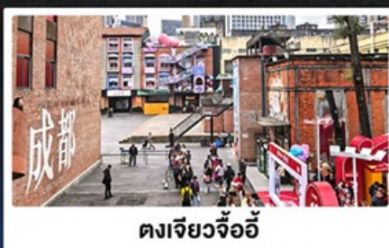
ตงเจียวจ้ออี้