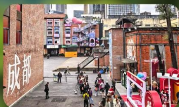
ตงเจียวจ้ออ๋อ