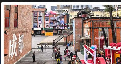
ตงเจียวจื้ออี้