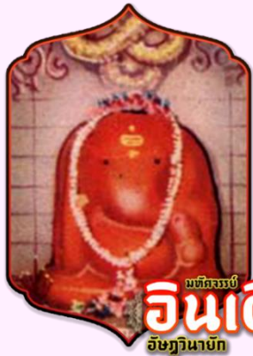
มหัศจรรย์ อินเดียน อัยยวินายก