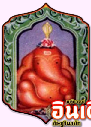
มหัศจรรย์ อินเดียน อัยยวินายก

นำท่านเดินทางสักการะ เทวสถานศรีมยูเรศวร (Shri Mayureshwar) ประดิษฐานอยู่ที่ โมเร กาว์ (Morgaon) กษัตริย์จักรปาณี และ พระนางอัครา ได้ทำพิธีขบوترจาก สุริยเทพ เมื่อทรง ครรภ์พระนางก็ไม่สามารถทนความร้อนแรงที่เกิดจากทารกในครรภ์ได้ จึงขับทารกออกจากครรภ์ และได้นำตัวอ่อนของทารกไปฝากไว้กับ พระสมุทร ในทะเล บังเกิดเป็นทารกที่มีกายสีแดง พระโอรสได้รับพระนามว่า สินธุ เพราะถือกำเนิดจากทะเล เมื่อสินธุเติบโตขึ้น บำเพ็ญตบะพร่ำ สวดมนตราภาวนาต่อองค์พระสุริยเทพเป็นเวลาถึงสองพันปี จนสุริยเทพพอพระทัย จึงเสด็จมา ให้พรสินธุขอพรให้เป็นอมตะ สุริยเทพประทานหม้อน้ำอมฤตโดยบอกว่า トラบใดที่น้ำอมฤตนี้ยัง อยู่ในห้อง ก็จะไม่มีผู้ใดฆ่าสินธุได้ เมื่อได้พรแล้วก็กลับมายังอาณาจักรสืบราชสมบัติต่อจากพระ บิดา แต่นิสัยใจคอนั้นดุร้ายเหี้ยมโหดดังอสูร จับเทวดานางฟ้ากักขัง จนบรรดาทวยเทพต้อง ร่วมกันอ้อนวอนต่อองค์พระคเณศให้ช่วยเหลือ พระคเณศทรงประทับมาบนหลังนกยูง ใช้ขวาน ผ่าท้องสินธุ เอาหม้อน้ำอมฤตออกจากท้องแล้วสังหารสินธุด้วยการตัดหัว หลังจากที่ถูกหัวของสินธุ ขาดก็เกิดเป็นสีแดงสดใสสะอาดไปทั่วทั้งสวรรค์ บังเกิดเป็นผงเจิมสีแดงสดที่ใช้ในการบูชาเทพเจ้า ผงนี้จึงมีชื่อเรียกอีกอย่างว่า "ผงสินธุ" ผู้ที่มาสักการะองค์ "พระศรีมยูเรศวร" จะปราศจาก อุปสรรคและอันตรายใดๆมาแผ้วพาน