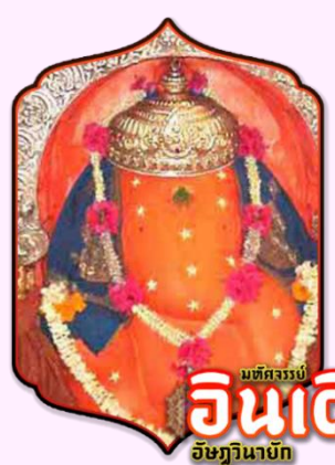
มหัศจรรย์ อินเดียน อัยยวินายก