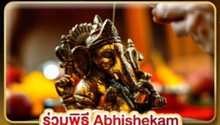
ร่วมพิธี Abhishekam