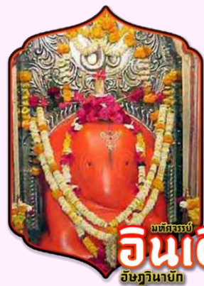
มหัศจรรย์ อินเดียน อัยยวินายก