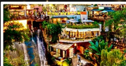
ถนนโบราณหลงเหมินซ่าว