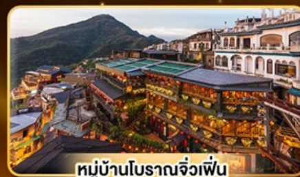
หมู่บ้านโบราณจ้วเพิ่น