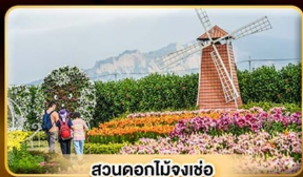
สวนดอกไม้จ้งเซ่อ

เค้กัฒดาวนัฒฏักไทเป 101 แซ่หน้าแร่ส่วนตัวในห้องพัก