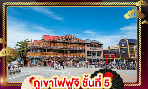
กุหาไฟฟูจิ ชั้นที่ 5

ชมลาวเอนเดอร์ ที่ สวนโออิชิปาร์ค อิสระ 1 DAY TRIP