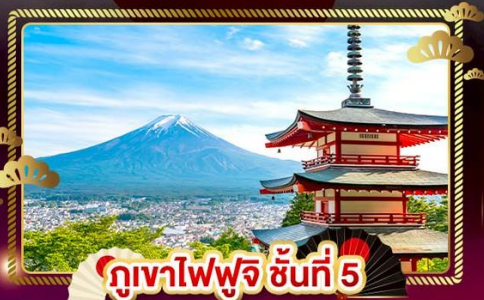
ภูเขาไฟฟูจิ ชั้นที่ 5

ชมลาวนเดอร์ ที่ สวนไอชิปาร์ค อิสระ 1 DAY TRIP