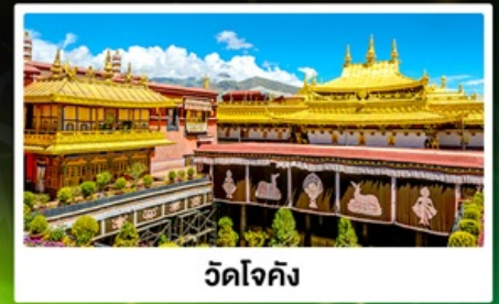
วัดโจคัง