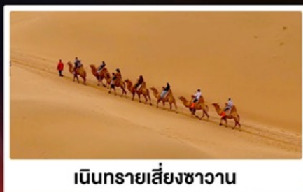
เนินทรายเลี้ยงชวาาน