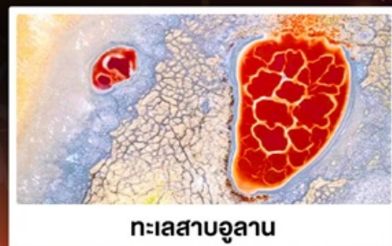
ทะเลสาบอูแลาน