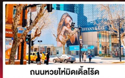
ถนนหวยไห่มีดัดส์โรด