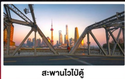
สะพานไวปี้ตู่