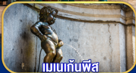
แมนกันพีส