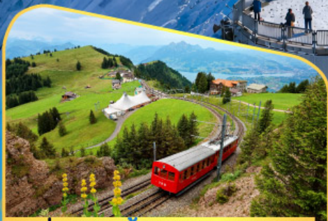
นั่งรถไฟขึ้นสู่ยอดเขาจาร์ก