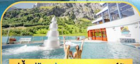
แช่น้ำแร่ร้อนผ่อนคลายลวยคอร์บิต