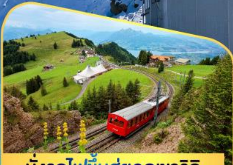
นั่งรถไฟขึ้นสู่ยอดเขาโรติก