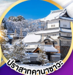
ปราสาทคานาซาว่า