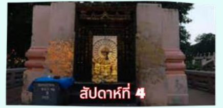
รัตนขรเจดีย์ (ซุ้มเรือนแก้ว)

เรียบร้อยแล้ว นำคณะจาริกบุญสวดมนต์ทำวัตรเย็น บูชาพระรัตนตรัย และสวดมนต์บูชาสังเวชนียสถาน จากนั้นเชิญท่านทัศนารธรรม นั่งสมาธิปฏิบัติบูชาตามอัยาศัย สมควรแก่เวลา นัดหมายเวลาเชิญท่านกลับโรงแรมที่พัก