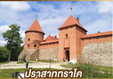
ปราสาททราไค