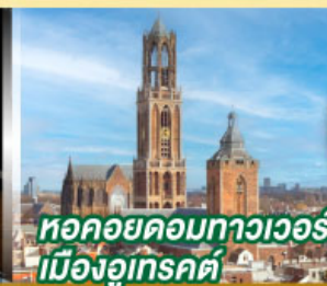
หอคอยคอกทาวเวอร์ เมืองอูเทรคต์