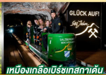
เหมืองเกลือเบิร์ชเทสกาเดิน