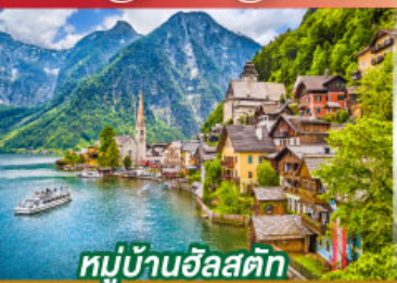
หมู่บ้านอัลสติก