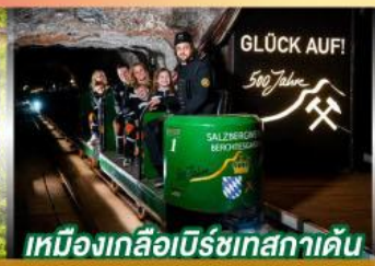
เหมืองเกลือเบิร์ชเทสกาเดิน