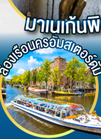
ล่องเรือนครอัมสเตอร์ดัม