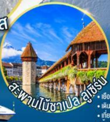
สะพานไม้ชาเปล ลูเซิร์น