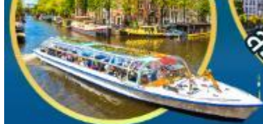
ล่องเรือนครอัมสเตอร์ดัม