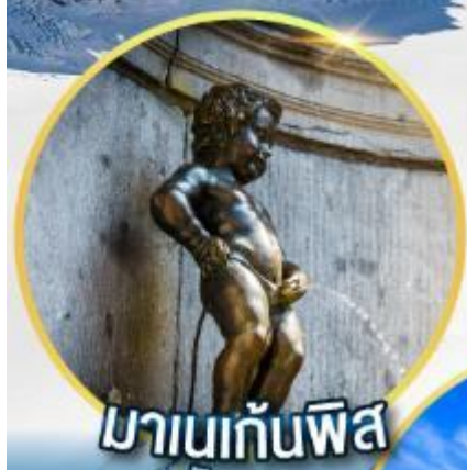
มานกันพิส