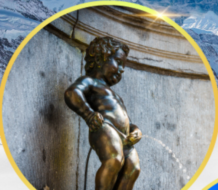
มานกันพีส