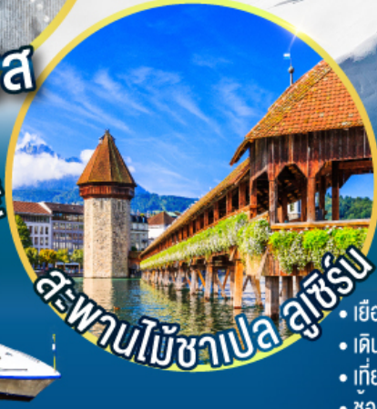
สะพานไม้ชาเปลูเซิร์น