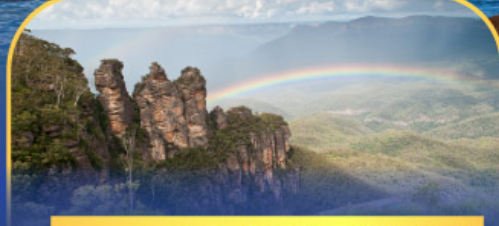
อุทยานแห่งชาติบลูเมาท์เทนส์ Three Sister Rock