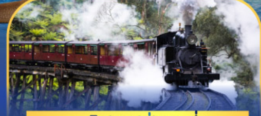
รถไฟฟฟิงบิลลี่

ล่องเรือชมอ่าวซิดนีย์พร้อมรับประทานอาหารกลางวัน และ เข้าชมสวนสัตว์การองก้า