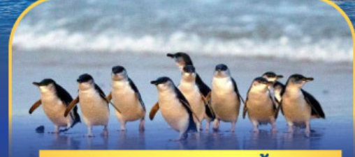
พาหรรณกเพนกวิน