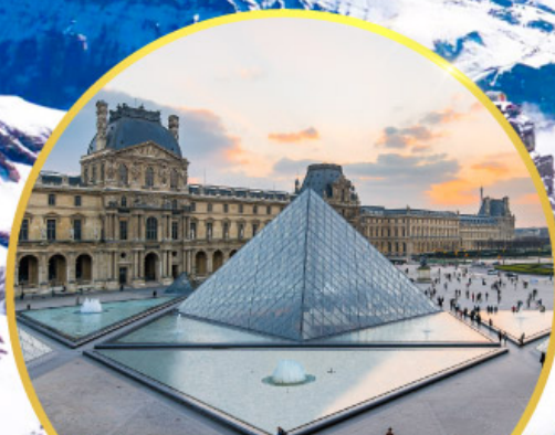
ถ่ายรูปคู่พีพีรกันที่ลูฟร์