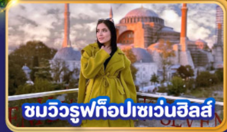
ชมวิวยูฟือปเซเวนฮิลส์