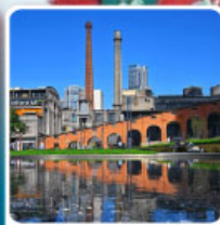
Eastern Suburb Memory Chengdu