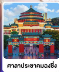
ศาลาประชาคมดงซิ่ง