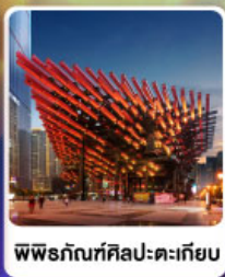
พิพิธภัณฑ์ศิลปะตะเกียบ