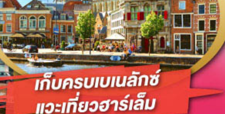
เก็บครบเบเนลักซ์ แวะเที่ยวฮาร์เล็ม