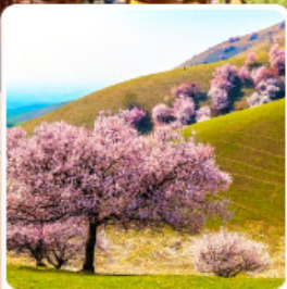
ทุ่งดอกอัลมอนด์