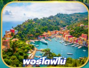
พอร์ตอฟินอ์