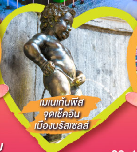
เมเนกันพิส จุดเช็คอิน เมืองบริสเซลส์