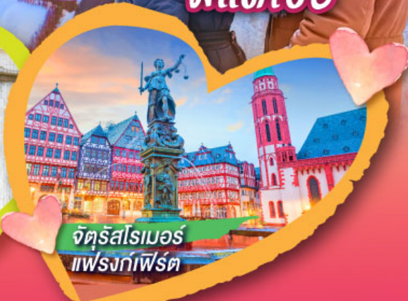
จัตุรัสโรเมอร์ แฟรงก์เฟิร์ต