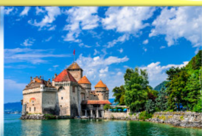
ปราสาทชิลยง