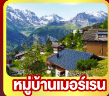
หมู่บ้านเมอร์สเน

พิเศษ!! พิซิค 4 เทา ยอดเทารีกิ , ยอดเขาจุงเฟรา ยอดเขารอนเนอร์เกรตและยอดเขาเอกทิสวอร์น