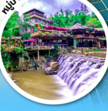
หมู่บ้านชาวเขากัดกัด