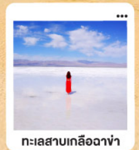
ทะเลสาบเกลือฉางซ่า