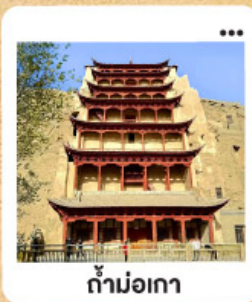
ถ้ำม่อเกา