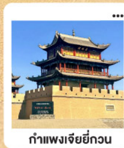
กำแพงเจียหยกวน