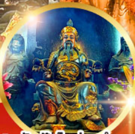
วัดปักโต้อ่องอำ