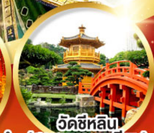
วัดซีหลิน