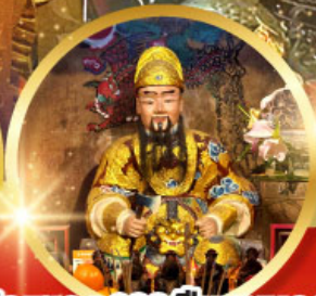
วัดแซกง 600 ปี หุ่นทอง