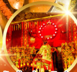
วัดเจ้าแม่กวนอิมอ่องอำ (สวนหนานเท่เลียน)