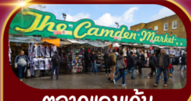
ตลาดแคมเดน