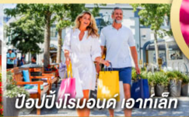
ป๊อปบิงโรมอนด์ ไอเกิ้ล