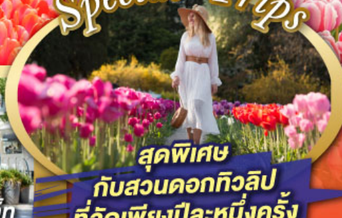
สุดพิเศษ กับสวนดอกทิวลิป ที่จัดเพียงปีละหนึ่งครั้ง