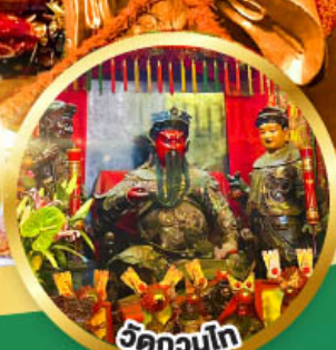
วัดกวนโก