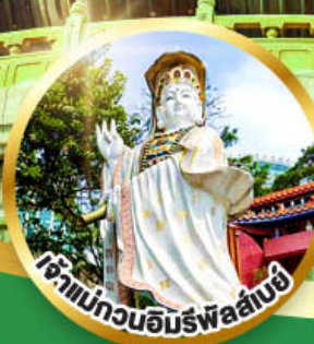
เจ้าแม่กวนอิมพรหลั่งน้ำทิพย์