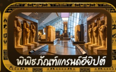
พีพีธกรัทท์แกรนด์อียิปต์