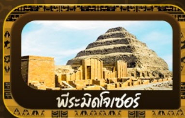
พีระมิดโจเซอร์