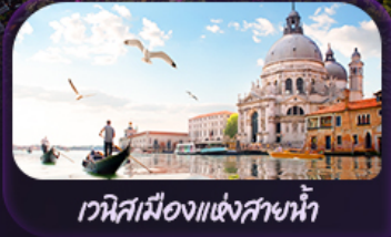
เวนิสเมืองแห่งสายน้ำ