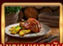
Ribs of Vienna, ปลาเทราสย่าง, จาหมูเยอรมัน

ตะลุยพิชิตยอดเขาทุกสปีซ "Top of Germany" เยือนเมืองมิวนิก จัดดูสมาเรียมพลาทซ์ สัมผัสเมืองมรดกโลก เซสท์ ครุมลอฟ เยี่ยมชมปราสาทปราก ย้อนรอยอดีตซาลซ์บูร์ก สวนมิราเบล บ้านเกิดของโมซาร์ท ปราสาทบราติสลาวา มหาวิทยาลัยเซนต์มาร์ติน สุดโรแมนติกส่องเรือชมความงามแม่น้ำดานูบ จัดดูสวีตบุรุษ พระราชวังฮอฟบวร์ก ขึ้นดากับความน่าหลงใหลของ หมู่บ้านริบทะเลสาบฮัลล์สตัดท์ พระราชวังเซินบรุนน์ ปิดท้ายช้อปปิ้งจุใจ