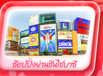
ช้อปปิ้งย่านชินโซบาชิ