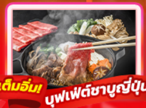
เต็มอิ่ม บุฟเฟ่ต์ซาบุมิญี่ปุ่น