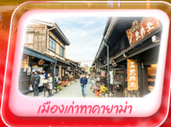
เมืองเก่าทาคายามา