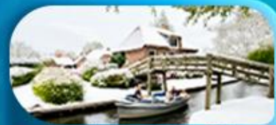
ล่องเรือชมหมู่บ้านทึโรน

พิเศษ ล่องเรือแม่น้ำเซน ชมเมือง โดย บาโต มูช