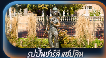
รูปปั้นชาร์ลี แชปลิน

เที่ยวครบจบทุก Highlight ตะลุยจุดเพรา วิวอลังการจัดเต็มสมชื่อ Top Of Europe สักครั้งในชีวิตหมู่บ้านเซอร์แมท นั่งรถไฟสาย Gornergrat bahn หมู่บ้านเลาเทอร์บรุนเนินสวยเหมือนเทพนิยาย เปิดประสบการณ์โรแมนติกส่องเรือทะเลสาบรุน ทะเลสาบเจนีวา น้ำพุจรวดเจกโต ศาลาไทย รูปปั้นชาร์ลี แชปลิน The Fork ปราสาทซิลยอง หมู่บ้านอิซลทอวอลด์ สิงโตแกะสลัก สะพานไม้ชาเปล โบสถ์ฟรอนมุนสเตอร์ ซ็อบบิงจุงถนนบานโฮฟชตราซอร์