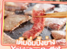
เค็มอัมบิย่าง Yakiniku Buffet