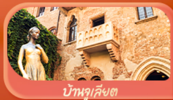
บ้านลูเลียง

เวนิส มิลาน เวโรนา ซูริก ลูเซิร์น โลซาน เซอร์แมท