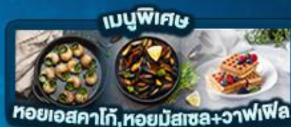
เมนูพิเศษ หอยแอสคาโก้, หอยมัสเซล+วาฟเฟิล

พิเศษ ล่องเรือแม่น้ำเซน ชมเมือง โดย บาโต มูช