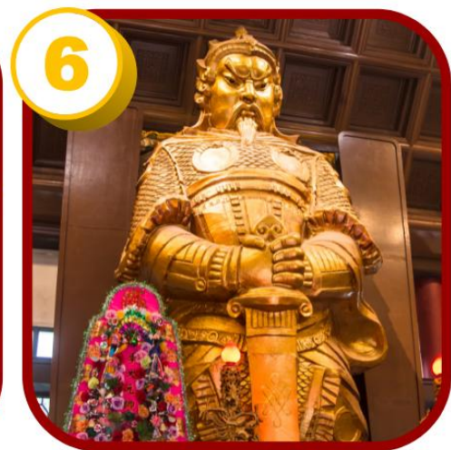
6 วัดแชกง (ซ่าถิ้น)