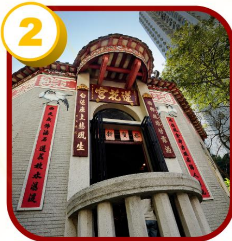
2 วัดหลินฟ้า