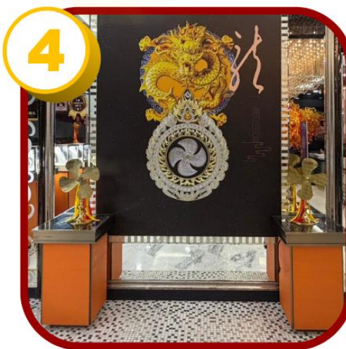
4 ศูนย์ฮวงจู้กั๊กหัน