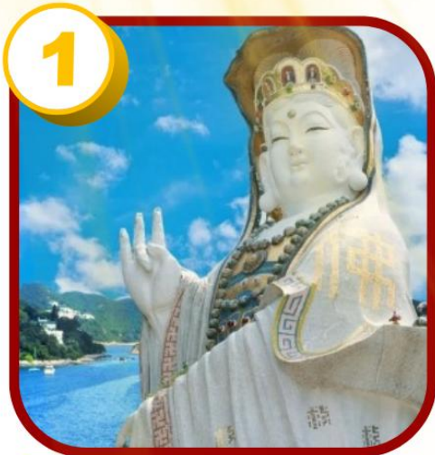
1 รัฟส์เบย์