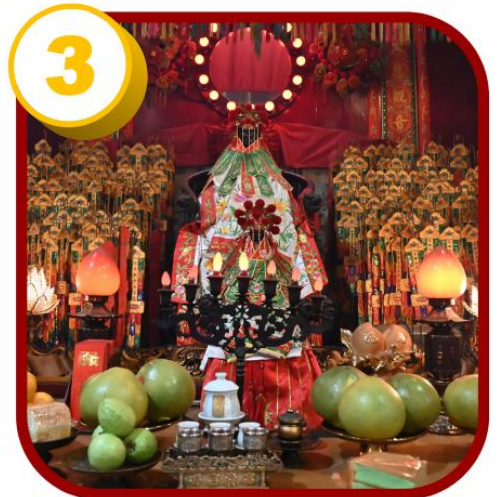
3 วัดเจ้าแม่กวนอิมสองห้า