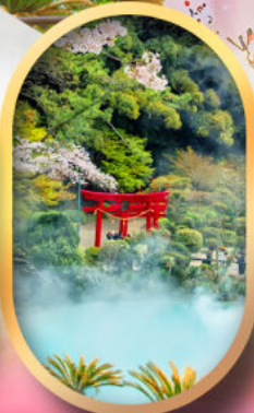
อุมิจิกุ