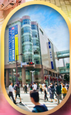
ช้อปปิ้งย่านเท็นจิน