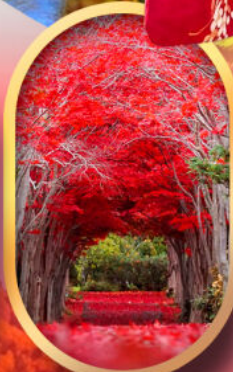
สวนฮิราโอกะ